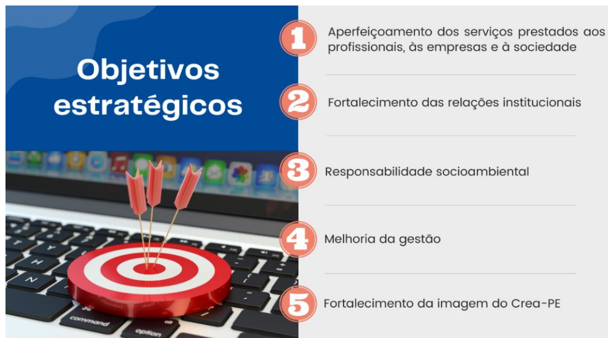
Figura 3 - Objetivos Estratégicos do Crea-PE

Uma vez definidas, as prioridades e a estimativa orçamentária plurianual orientarão a elaboração das diretrizes orçamentárias, do plano de trabalho e do orçamento anuais, garantindo a viabilidade das metas e a rastreabilidade dos resultados estratégicos.